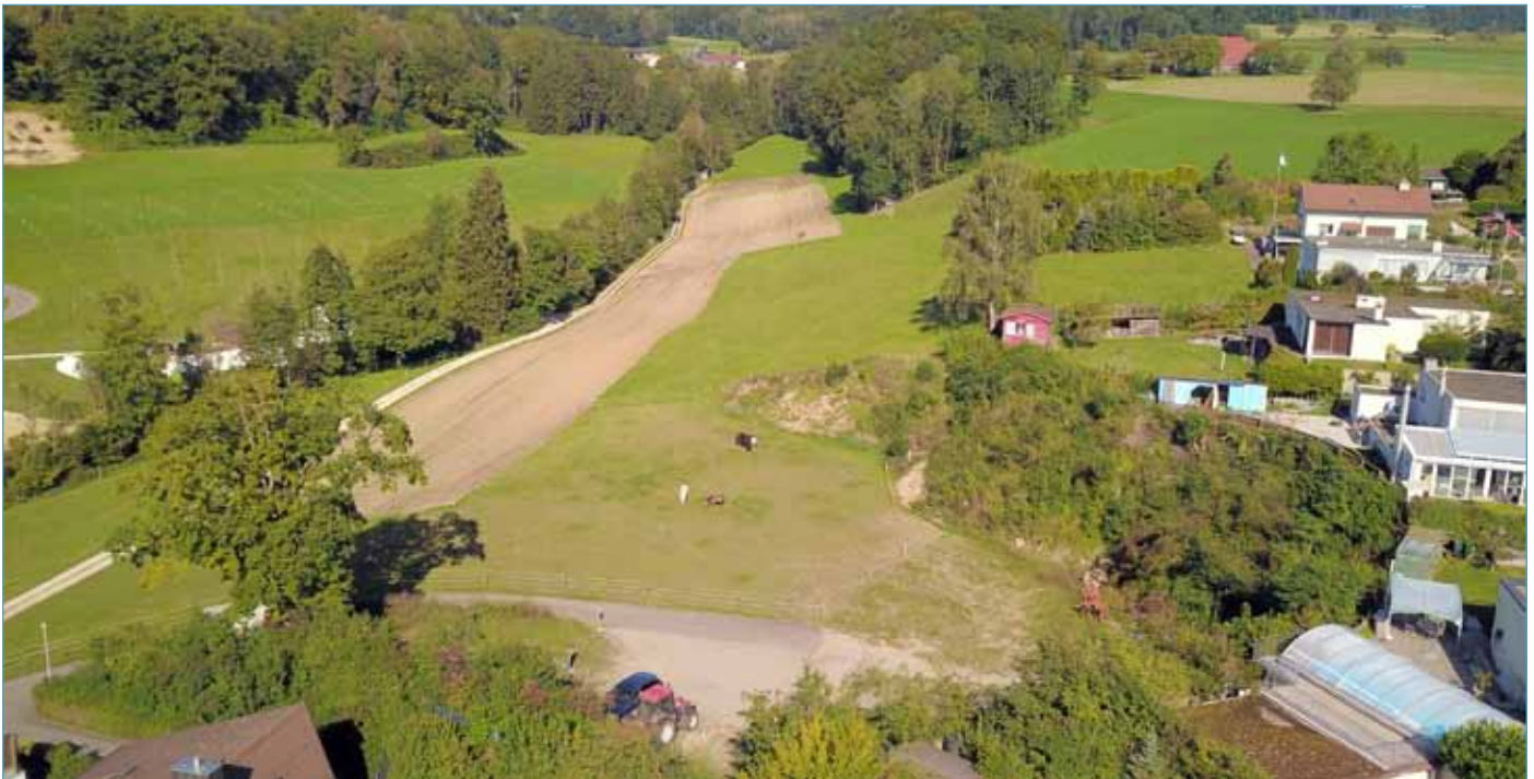
> Aufnahme Schützenhausparzelle aus der Vogelperspektive